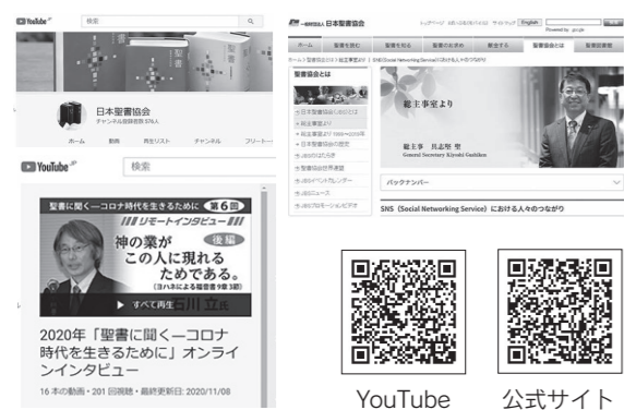
日本聖書協会の公式ウェブサイトやSNS (Facebook, Twitter, YouTube) 紹介